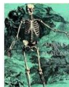
「Albinus on Anatomy」 Dover Publications 1,800 円(Amazon 価格)