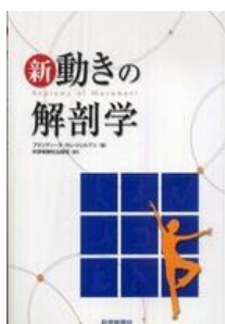
「新・動きの解剖学」 科学新聞社(2009/3 第3版) Blandine Calais-Germain (著), 仲井 光二 (著) 6,300 円