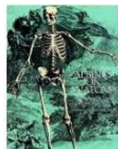
「Albinus on Anatomy」 Dover Publications 1,800 円 (Amazon 価格)